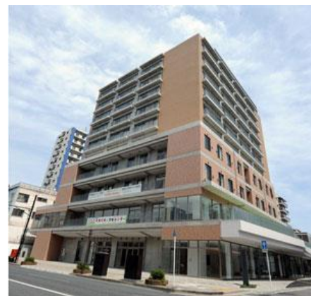
高崎市田町 71 番地 多機能型住居オアシス高崎 2 階フロア

安心して子どもを産み、育てることができることを目的に、子育て支援、就労支援、託児など、市・関係機関・NPO 団体などが一体となって運営する子育て支援の拠点として期待されています。