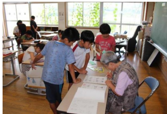
ステップアップ講座