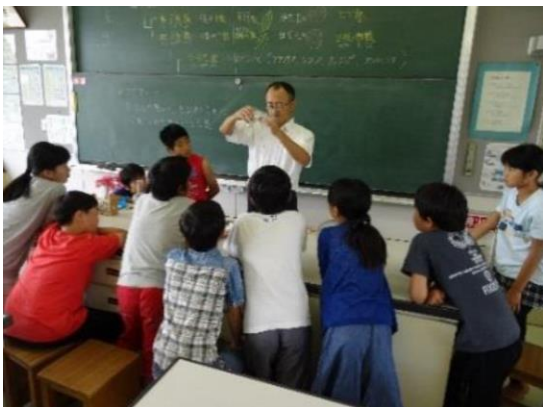
土曜寺子屋講座 理科実験

「いきいき寺子屋活動」は、土曜日の 9:00~12:00 に 3 時限学習を行う「土曜寺子屋講座」でスタートしています。その後、児童、生徒、保護者、学校教職員の要望によって広がり、中学生を対象とした「夏季・冬季特別講座」、部活動のない水曜日に行く「水曜日講座」の開設。さらに参加の難しい児童・生徒に向けた「テレビ寺子屋講座」も創設されています。土曜寺子屋講座の実施校も増加し、現在は市内すべての小・中学校で土曜寺子屋講座が実施されている状況です。